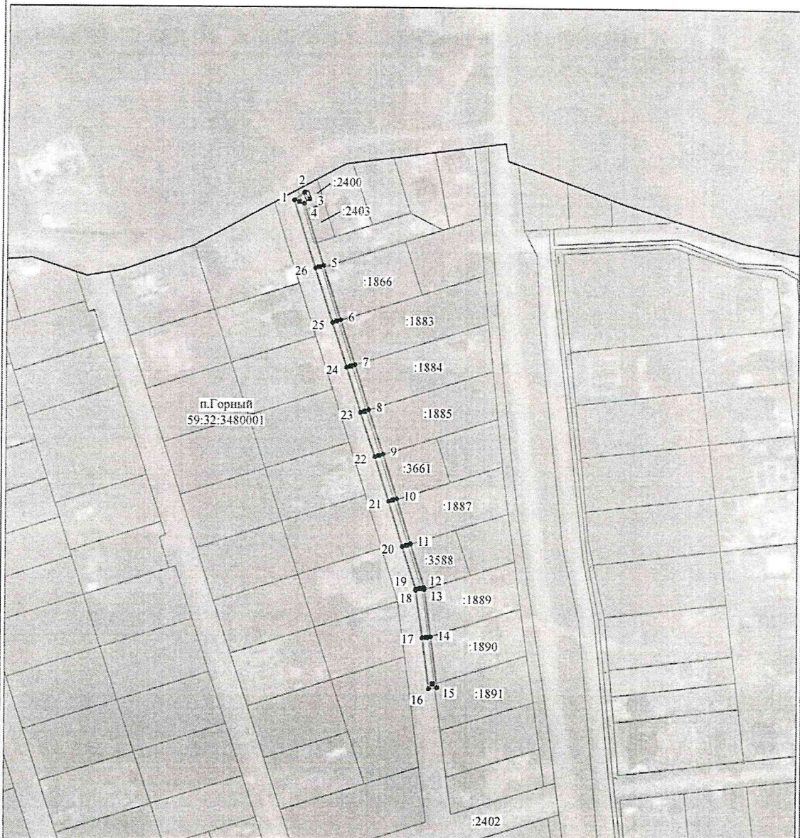
Схема расположения границ публичного сервитута объекта